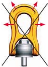
Figur 2: fel