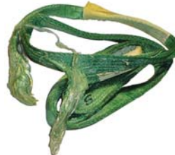
Strop udsat for syre