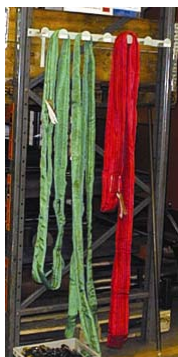
Korrekt opbevaring af stropper

Anhugningsgrej bør efterses mindst én gang om måneden og skal gennemgå et hovedeftersyn mindst hver 12. måned.