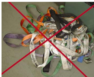
Forkert opbevaring af stropper