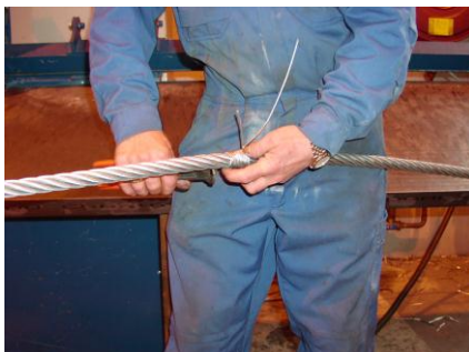
Montering av bendselwire

Deretter sikrer en enden på kabelstrømperen med en bendselwire eller en ståltråd ved å surre bendselwiren rundt enden av kabelstrømperen. Deretter ruller en tape over bendslingen slik at der ikke er noen skarpe kanter som kan henge seg fast under treding av wiren.