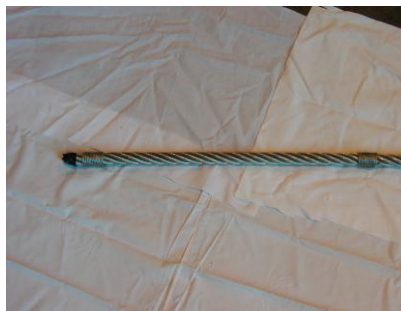
Bendselwire påmontert på i enden og inne på wire